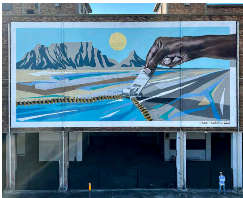
Kurateret af Udenrigsministeriet Cape Town