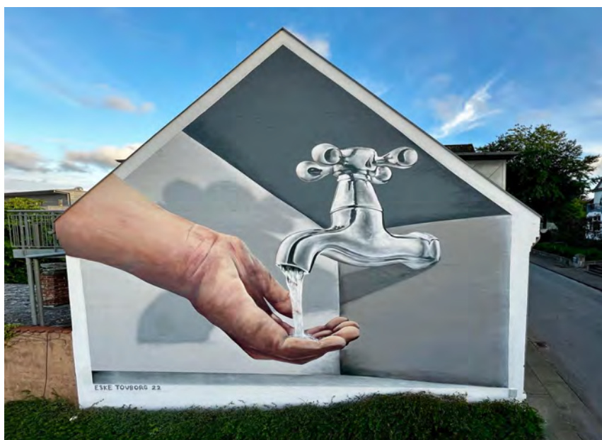
17 verdensmåls gavle Skive